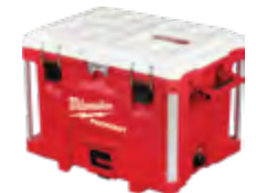
48-22-8462 Hielera XL PACKOUT™ 40oz