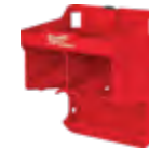
48-22-8343 Estación de herramienta PACKOUT™