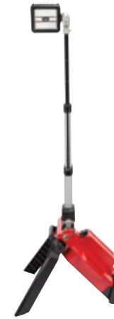
2120-22HD Lámpara de torre M18™ ROCKET™ de doble batería con kit ONE-KEY™ con (2) baterías HIGH OUTPUT™ XC8.0