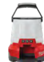
2145-20 Lámpara de obra compacta M18™ RADIUS™