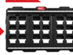
48-22-8497 Placa grande para pared PACKOUT™