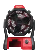
0886-20 Ventilador de obra M18™