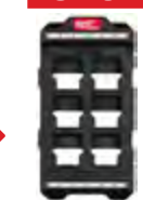
48-22-8496 Placa compacta para pared PACKOUT™

Echa un vistazo a nuestras herramientas eléctricas, juegos de herramientas manuales y kits de accesorios compatibles con PACKOUT™