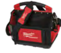
48-22-8315 Bolso PACKOUT™ de 15" (381 mm)