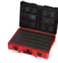
48-22-8450 Estuche para herramientas PACKOUT™ con insertos personalizables 48-22-8451 Inserto de espuma personalizable