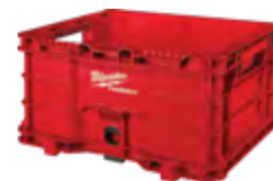
48-22-8440 Cajón PACKOUT™