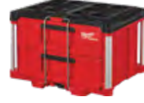
48-22-8442 Caja de herramientas de 2 cajones PACKOUT™