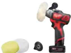
2438-22X Kit de pulidora/lijadora de velocidad variable M12™ con (1) batería XC3.0 y (1) batería CP1.5 2438-20 Pulidora/lijadora de velocidad variable M12™