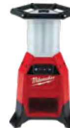
2151-20 Lámpara de obra M18™ RADIUS™