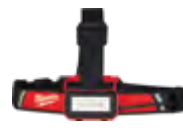
2115-21 Kit de linterna frontal de bajo perfil REDLITHIUM™ USB recargable