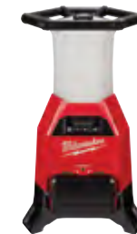
2150-20 Lámpara de obra/cargador M18™ RADIUS™ con ONE-KEY™