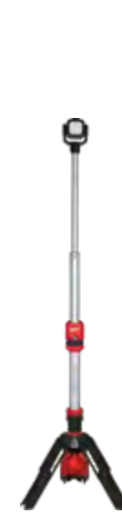
2132-20 Lámpara de torre M12™ ROCKET™ de doble alimentación