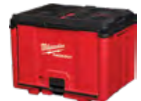
48-22-8445 Armario PACKOUT™