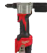
2550-22 Kit de remachadora M12™ con (2) baterías CP1.5 2550-20 Remachador a M12™