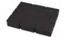
48-22-8452 Inserto de espuma personalizable para cajas de herramientas con cajones PACKOUT™