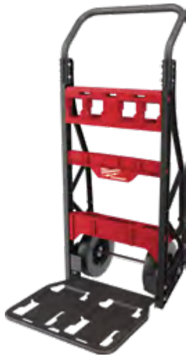
48-22-8415 Carretilla de 2 ruedas PACKOUT™