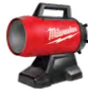
0801-20 Calentador de propano de aire forzado M18™ 70,000 BTU