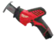
2420-21 Kit de sierra recíproca M12™ HACKZALL® con (1) batería CP1.5 2420-20 Sierra recíproca M12™ HACKZALL®