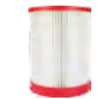
49-90-1977 Filtro HEPA para aspiradora en húmedo/seco grande