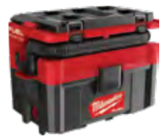
M18 FUEL 0970-20 Aspiradora en húmedo/seco PACKOUT™ de 2.5 Gal (9,4 litros)