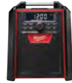
2792-20 Radio/cargador para obras M18™