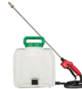
49-16-28PS Conjunto de tanque para rociador SWITCH TANK™ de 4 galones (15 l)