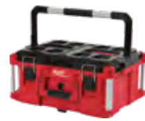
48-22-8425 Caja de herramienta grande PACKOUT™