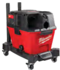
M18 FUEL 0910-20 Aspiradora en húmedo/seco de 6 galones (22,7 l)

0970 y 0960 Accesorios relacionados: 49-90-1900 Filtro 49-90-201 7 Herramienta de cepillo redondo de 1-1/4" (31,7 mm) 49-90-201 8 Adaptador para aspiradora eléctrica