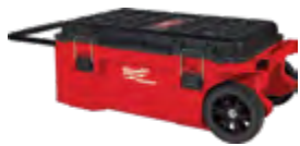
48-22-8428 Baúl rodante para herramientas PACKOUT™