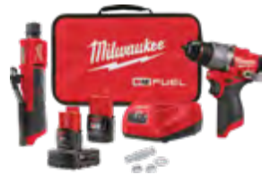
M12 FUEL 3459-22 Kit comercial de reparación de pinchazos con (1) batería XC4.0 y (1) batería CP2.0