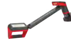
2126-21XC Kit de luz para carrocería inferior M12™ con (1) batería XC4.0