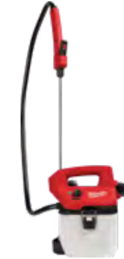
2528-21G1 Kit de rociador de mano M12™ 1 galón (3,7 l) 2528-21G2 Kit de rociador de mano M12™ de 2 galones (7,5 l)