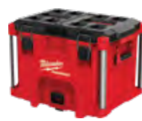
48-22-8429 Caja de herramientas XL PACKOUT™