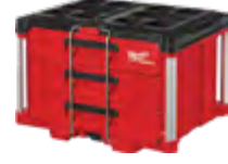
48-22-8443 Caja de herramientas de 3 cajones PACKOUT™