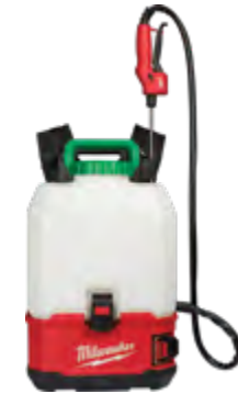
2820-21PS Kit de rociador de mochila de 4 galones (15 l) M18™ SWITCH TANK™ con (1) batería XC3.0