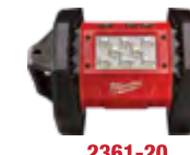
2361-20 Reflector M18™ ROVER™