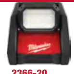
2366-20 Reflector M18™ ROVER™ de doble alimentación