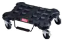
48-22-8410 Carrito PACKOUT™