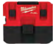
M12 FUEL 0960-20 Aspiradora en húmedo/ seco de 1.6 galones (6 l)

0970 y 0960 Accesorios relacionados: 49-90-1900 Filtro 49-90-201 7 Herramienta de cepillo redondo de 1-1/4" (31,7 mm) 49-90-201 8 Adaptador para aspiradora eléctrica