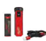
48-59-2013 Kit de cargador y fuente de alimentación portátil REDLITHIUM™ USB recargable 48-59-2012 Cargador y fuente de alimentación portátil REDLITHIUM™ USB recargable