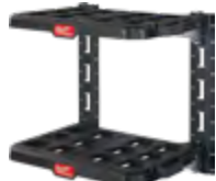
48-22-8480 Kit de estantería PACKOUT™ compatible con E-Track