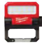
2114-21 Kit de reflector giratorio REDLITHIUM™ USB recargable ROVER™