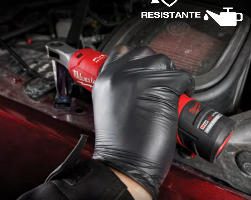
PAQUETE DE BATERÍA M12™ REDLITHIUM™ HIGH OUTPUT™ CP2.5 48-11-2425