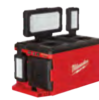
2357-20 Luz/cargador M18™ PACKOUT™