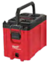
48-22-8422 Caja de herramienta compacta PACKOUT™