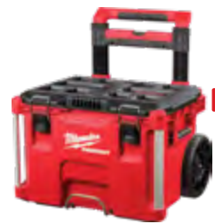
48-22-8426 Caja de herramientas con ruedas PACKOUT™