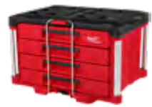
48-22-8444 Caja de herramientas con 4 cajones PACKOUT™