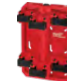
48-22-8349 Estantería para herramientas de mango largo PACKOUT™