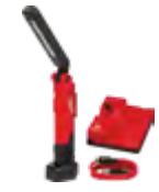
2128-22 Minilinterna con imán y base de carga REDLITHIUM™ USB