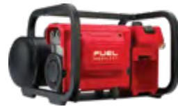
M18 FUEL 2840-20 Compresor silencioso compacto de 2 galones (7,5 litros)