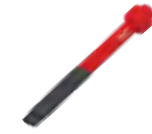
49-90-2030 Herramienta para hendiduras flexible y largo alcance