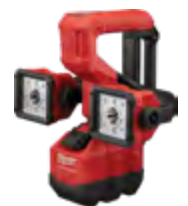
2122-21HD Kit de lámpara de canasta M18™ para servicio eléctrico con (1) batería HIGH OUTPUT™ XC8.0