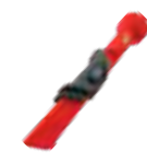
49-90-2023 Cepillo 3 en 1 para hendiduras