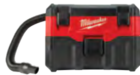
0880-20 Aspiradora en húmedo/seco M18™ Accesorio relacionado: 49-90-1900 Filtro