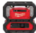
2845-20 Suministro de energía M18™ CARRY-ON™ 3600W / 1800W (Las baterías se venden por separado)