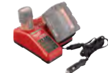
48-59-1810 M18™ and M12™ Vehicle Charger (Batteries Sold Separately)