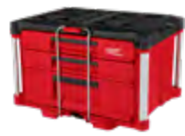
48-22-8447 Caja de herramientas de 3 cajones y profundidad múltiple PACKOUT™