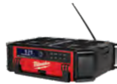
2950-20 Radio + cargador M18™ PACKOUT™