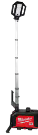
MXF040-1XC Kit de torre de iluminación compacta de alimentación doble MX FUEL™ ROCKET™