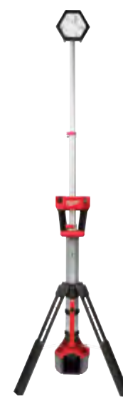
2131-20 Lámpara de torre M18™ ROCKET™ de doble alimentación