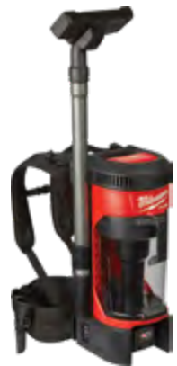
M18 FUEL 0885-20 Aspiradora de mochila 3 en 1 Accesorios recomendados: 49-90-1963 Filtro HEPA 49-90-1964 Accesorio de manguera de 9" (228 mm)