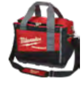
48-22-8321 Bolsa de herramientas PACKOUT™ de 15" (381 mm)