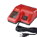
48-59-1812 M18™ and M12™ Multi-Voltage Charger