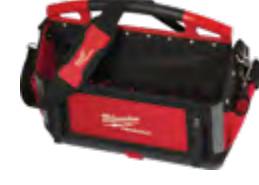
48-22-8320 Bolso PACKOUT™ de 20" (508 mm)