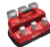
RAPIDCHARGER 48-59-1807 M18™ and M12™ Rapid Charge Station (Batteries Sold Separately)