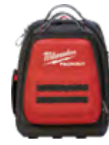
48-22-8301 Mochila PACKOUT™