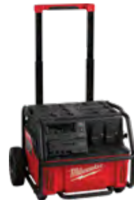
3300R Suministro de energía 2.5kWh ROLL-ON™ 7200W / 3600W