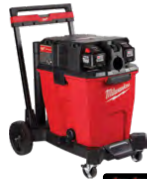
M18 FUEL 2 BATERÍAS REQUERIDAS E INCLUIDAS 0930-22HD Kit de aspiradora en húmedo/seco de doble batería, 12 galones (45 l) con (2) baterías HIGH OUTPUT™ HD12.0