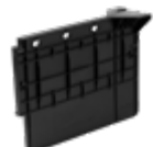
48-22-8040 Divisor para caja PACKOUT™