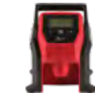
2475-20 Inflador compacto M12™