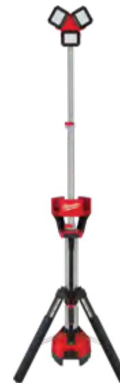
2136-20 Lámpara/cargador de torre M18™ ROCKET™