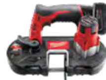
2429-21XC Kit de sierra de banda subcompacta M12™ con (1) batería XC3.0