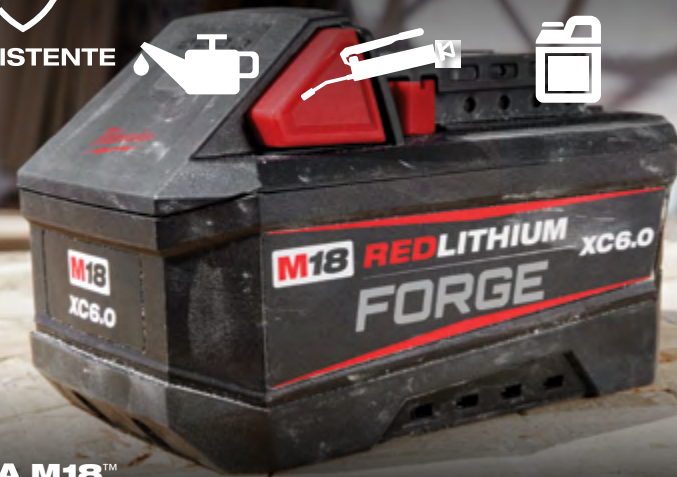
PAQUETE DE BATERÍA M18™ REDLITHIUM™ FORGE™ XC6.0 48-11-1861