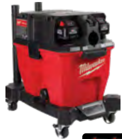
M18 FUEL 2 BATERÍAS REQUERIDAS E INCLUIDAS 0920-22HD Kit de aspiradora en húmedo/seco de doble batería, 9 galones (34 l) con (2) baterías HIGH OUTPUT™ XC8.0