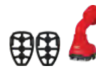
49-90-2020 Cepillo giratorio para la palma de la mano