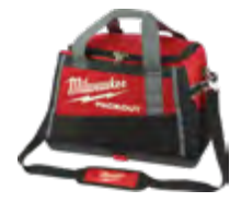
48-22-8322 Bolsa de herramientas PACKOUT™ de 20" (508 mm)