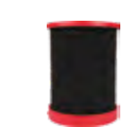
49-90-1990 Filtro esponja en húmedo para aspiradora en húmedo/seco grande