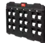
48-22-8487 Placa grande para pared PACKOUT™