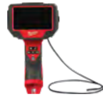
3150-20 Boroscopio para técnicos de automóviles M12™