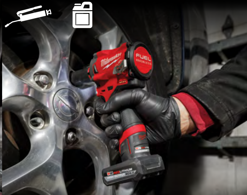
PAQUETE DE BATERÍA M12™ REDLITHIUM™ HIGH OUTPUT™ XC5.0 48-11-2450