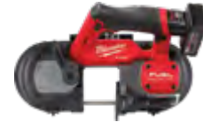
M12 FUEL 2529-21XC Kit de sierra de banda compacta con (1) batería XC4.0