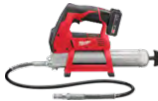
2446-21XC Kit de pistola de engrasar M12™ con (1) batería XC3.0