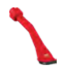
49-90-2040 Boquilla multiusos tipo pata con cepillo