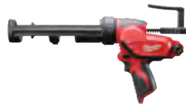
2441-20 Pistola de calafateo y adhesivo de 10 oz M12™ Accesorios relacionados: 48-08-090 5 Kit de conversión de pistola de calafateo y adhesivo con barril de aluminio estilo salchicha de 20 oz. M12™ 48-08-0910 Kit de conversión de pistola de calafateo y adhesivo de un cuarto de galón M12™