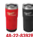
48-22-8392R Vaso PACKOUT™ 20oz Rojo 48-22-8392B Vaso PACKOUT™ 20oz Negro