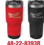
48-22-8393R Vaso PACKOUT™ 30oz Rojo 48-22-8393B Vaso PACKOUT™ 30oz Negro