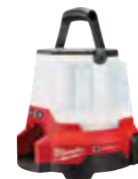
2146-20 Lámpara de obra compacta M18™ RADIUS™ con ONE-KEY™