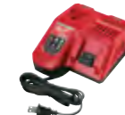
RAPIDCHARGER 48-59-1808 M18™ and M12™ Rapid Charger