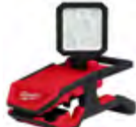
2358-20 Reflector de montaje M18™ ROVER™