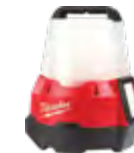
2144-20 Lámpara de obra compacta M18™ RADIUS™ con modo reflector