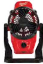
Ventilador de montaje M12™