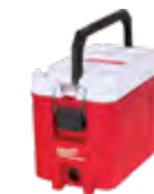
48-22-8460 Hielera compacta PACKOUT™ 16